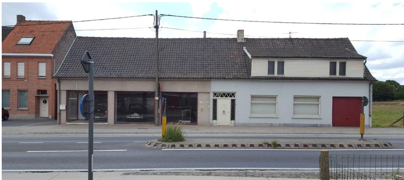
Café De Beurze - De Posterie (huis rechts) in 2017